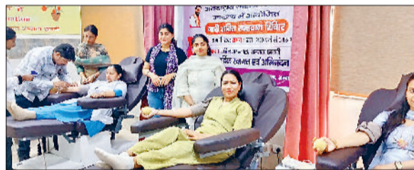
अंबाला। रक्तदान करती स्टाफ कर्मचारियां।

अंतरराष्ट्रीय महिला दिवस के अवसर पर स्वास्थ्य विभाग की ओर से नागरिक अस्पताल अंबाला शहर व अम्बाला छावनी में नारी शक्ति रक्तदान शिविर का आयोजन किया गया। शिविर में ब्लाड बैंक की टीम ने रक्त एकत्रित करने का काम किया। सिविल सर्जन डॉ. रेणु बेरी ने कहा कि रक्तदान जीवन का सबसे बड़ा दान है। एक स्वस्थ व्यक्ति को रक्तदान अवश्य करना चाहिए। रक्तदान करके हम अमूल्य जिन्दगीयों को बचा सकते हैं। उन्होंने यह भी कहा कि रक्त की पूर्ति केवल मानव शरीर से ही सम्भव है। उन्होंने