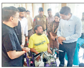
शहजादपुर। दिव्यांग से बातचीत करते डीसी अजय सिंह तोमर व अन्य।

उपायुक्त अजय सिंह तोमर ने कहा कि दिव्यांगों की सेवा करना सबसे बड़ा पुण्य कार्य है। समाज के जरूरतमंद और अंगविहीन लोगों को कृत्रिम अंग उपलब्ध करवाकर उन्हें आत्मनिर्भर बनाना एक अत्यंत सराहनीय कार्य है। उन्होंने कहा कि ऐसे सामाजिक कार्यों में समाज के प्रत्येक व्यक्ति को आगे आकर सहयोग करना चाहिए, ताकि दिव्यांगों की सम्मान और आत्मविश्वास के साथ अपना जीवन व्यतीत कर सके। उपायुक्त नारायण सेवा संस्थान उदयपुर द्वारा आयोजित निशुल्क कृत्रिम अंग वितरण शिविर को बतौर