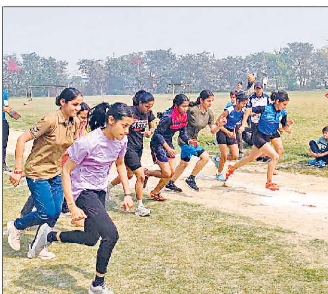
अंबाला। विजेताओं को सम्मानित करते हुए व दौड़ स्पर्धा में हिस्सा लेती युवतियां।