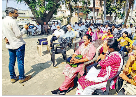
यमुनानगर। दशहरा ग्राउंड में कार्यक्रम को संबोधित करते कर्मचारी नेता।

सर्व कर्मचारी संघ तथा अन्य ट्रेड यूनियनों द्वारा रिविवा को शहर के दशहरा ग्राउंड में अंतरराष्ट्रीय महिला दिवस पर कार्यक्रम का आयोजन किया गया। जिसमें सेंट्रल इंडियन ट्रेड यूनियन, अखिल भारतीय जनवादी महिला समिति, रिटायर कर्मचारी संघ हरियाणा व अखिल भारतीय किसान सभा के सदस्यों ने भाग लिया। कार्यक्रम की अध्यक्षता