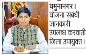
यमुनानगर। योजना संबंधी जानकारी उपलब्ध करवाती जिला उपायुक्त।

उपायुक्त ने बताया कि यह योजना आर्थिक रूप से कमजोर वर्गों को सशक्त बनाने और बेटियों के विवाह के लिए लाभ दायक योजना है। उन्होंने बताया कि मुख्यमंत्री विवाह शगुन योजना समाज में समानता और सशक्तिकरण का प्रतीक है। इस योजना का उद्देश्य आर्थिक रूप से कमजोर परिवारों को सहायता प्रदान करना और बेटियों की