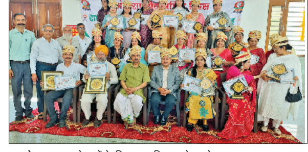
कुरुक्षेत्र। उत्कृष्ट सेवाओं के लिए सम्मानित करते आयोजक।

शिक्षण संस्थानों में नवीन राष्ट्रीय ध्वज जागरूकता अभियान चलाया जा रहा है। इस अभियान के तहत स्कूलों और कॉलेजों में कार्यक्रम आयोजित किए जा रहे हैं, जिनमें विद्यार्थियों को तिरंगे के महत्व और उसके सम्मान के बारे में जानकारी दी जाती है। कुरुक्षेत्र संसदीय क्षेत्र में सशक्तिकरण अभियान के तहत बड़े स्वास्थ्य शिविर लगाए जा रहे हैं। इन शिविरों में विशेषज्ञ डॉक्टरों द्वारा मरीजों की जांच की जाती है और उन्हें उपचार तथा परामर्श की सुविधा प्रदान की जाती है। इससे हजारों लोगों को निःशुल्क स्वास्थ्य सेवाओं का लाभ मिल रहा है।